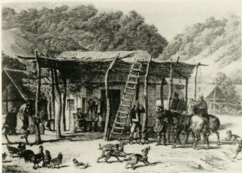
Un bodegón, Álbum de Claudio Gay.

una constancia heroica con la cual concluye por agradarla, pues ella, poco a poco, se humaniza y se acerca a él; pero, llamando luego en su ayuda toda la fuerza de su voluntad, se aleja nuevamente, hace aún otras piruetas y trata de evadirse del encanto que la desvanese. ¡Vanos esfuerzos! La pasión la arrastra; un último esfuerzo la conduce a su compañero, como el fierro al imán, y deja caer su pañuelo. Cuando baila la zamacueca, la mujer del pueblo lo hace con un ardor sin igual. Sus movimientos son vivos y alegres, algunas veces desiguales como el vuelo de las mariposas, algunas veces regulares como las oscilaciones del péndulo. A menudo ella zapatea de un modo bullicioso y particular, después, de repente, la punta de su pie, como desflorando el parquet, describe silenciosas curvas. Esta danza, en la mujer de sociedad no tiene nada que pueda tacharle la moral más severa; en ella sólo se ven pasos cadenciosos, artísticos, una desenvoltura plena de una muelle flexibilidad y, por último, gestos graciosos y moderados 77 .