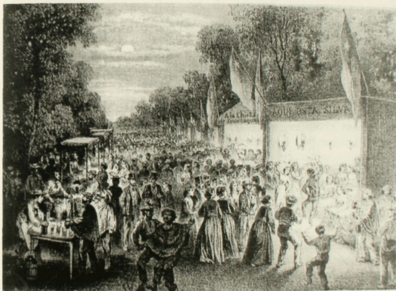
La Noche Buena en la Cañada, Recaredo Tornero, Chile Ilustrado .

Las chinganas eran espacios en los que se congregaba un número importante de personas, provenientes en su mayor parte de los estratos populares. La asistencia de gente de la elite se daba sólo en las ciudades, y era minoritaria. La presencia de estratos altos se daba por lo general sólo en festividades importantes como las celebraciones Patrias de septiembre, la fiesta de Navidad o algún matrimonio para el que se instalasen chinganas. Esto puede explicarse por los lugares marginales en los que se establecían las chinganas, distantes de los ámbitos espaciales visitados por la elite, especialmente en el caso de las ciudades.