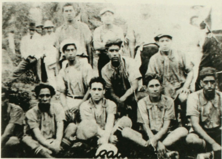
Equipo de fútbol Magallanes de la localidad de Nancagua, 1918.

series, amenizados por el melón con vino y la cerveza en los intermedios. Asimismo, hay que destacar la presencia de múltiples equipos que participan en los diversos campeonatos y copas locales.