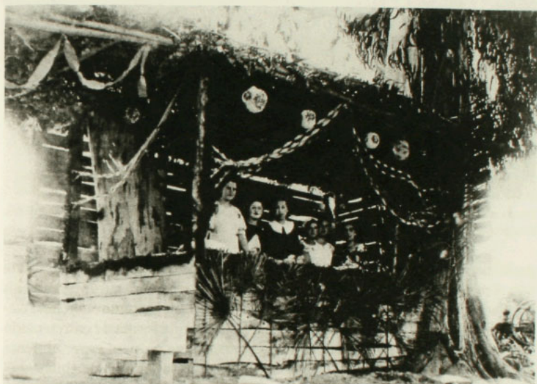
Rodeo de beneficencia. Nancagua, noviembre de 1935.

destacar esto, por cuanto existe la creencia a nivel de la sociedad chilena, de que los niveles de violencia que se dan en las fondas de Fiestas Patrias son muy altos. No sólo son escasos los hechos de violencia en relación a la gran cantidad de actos de este tipo que se desarrollaban durante el siglo pasado, sino que incluso son bajos para los parámetros que hoy en día maneja la sociedad al respecto. Sumado a esto hay que decir que ya prácticamente no hay "canto", sino música de orquesta o grabada, proveniente muchas veces de otros países, relegando al olvido con ello a la música "tradicional" chilena.