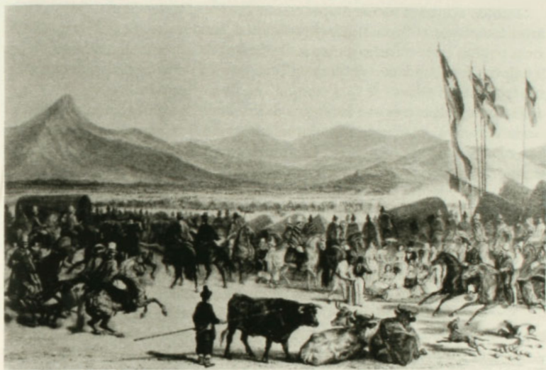
Una carrera en las lomas de Santiago. Album de Claudio Gay.

También podemos observar a un niño en el costado inferior derecho, jugando con un sombrero o escapando del paso de los caballos, lo que nos confirma la participación de gente de todas las edades en este tipo de diversiones.