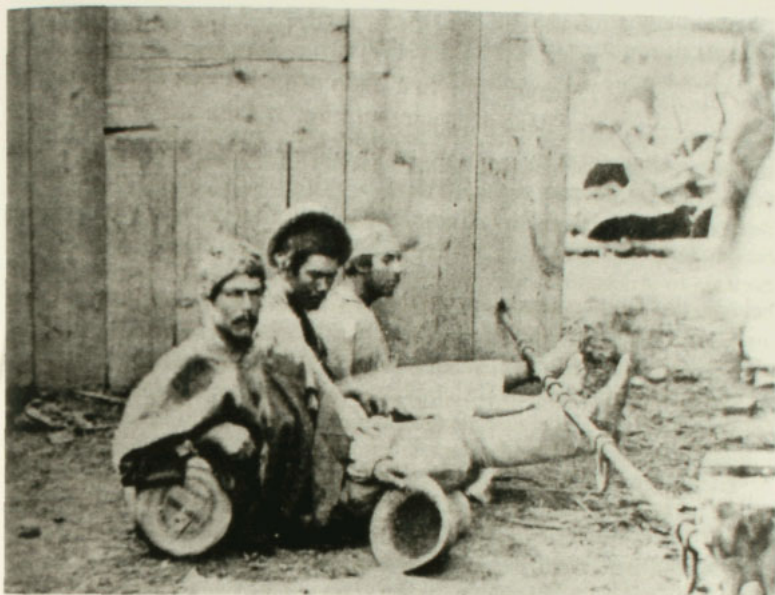
Peones castigados en la barra de cepo. Faenas del Ferrocarril del Sur , 1862.

método de represión y castigo físico. La fotografía que presentamos, perteneciente al Museo Histórico Nacional, muestra a tres peones de las faenas de construcción del ferrocarril del sur en 1862, castigados en el cepo por el delito de ebriedad.