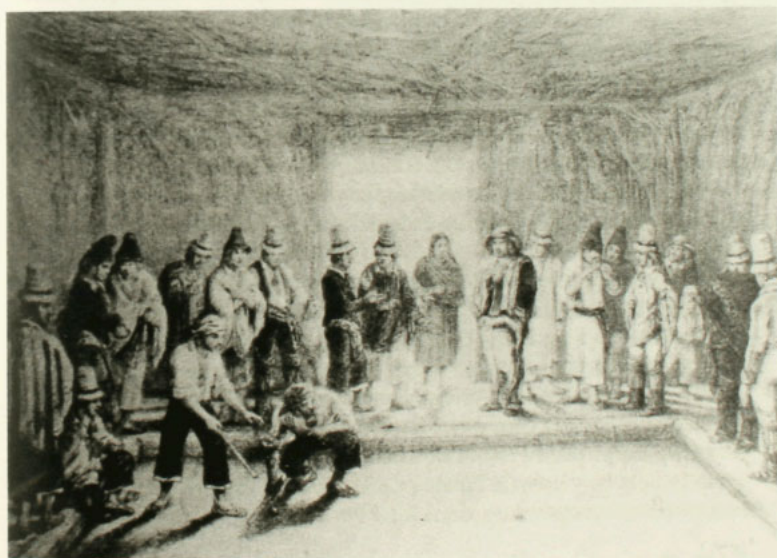
Juego de bolos. Album de Claudio Gay.

Este tipo de reuniones se desarrollaba principalmente los fines de semana, aunque también, en forma ilegal, los días de trabajo. Muchas veces se originaban problemas con los horarios de funcionamiento, porque los "cancheros" mantenían funcionando sus recintos hasta tarde o los abrían los domingos antes de la hora de misa, lo que estaba prohibido 124 . Las canchas de bolas eran espacios eminentemente masculinos, con una participación minoritaria de mujeres y niños, como hemos podido concluir a través de las fuentes revisadas. Ellas se convirtieron en el lugar de múltiples expresiones. Por una parte, estaba el juego mismo, con el atractivo de las apuestas pero, a la vez, se trataba de un espacio de convivencia social donde se desarrollaban otras diversiones como juegos de azar, naipes, dados, etc. Junto a esto, era muy común el consumo de alcohol, elemento esencial de las diversas formas de sociabilidad rural que estudiamos. Algunas canchas de bolas estaban abiertas durante todo el año, lo que aumentaba su atractivo. El juego de bolos era uno de los pocos que permanecían siempre vigentes. Otros juegos que incluían apuestas, como las carreras de caballos o riñas de gallos, eran esporádicos y necesitaban de una organización y preparación mayor. En el caso de los bolos, en cambio, se requería sólo construir la cancha, obtener el permiso y comenzar a funcionar. Este último aspecto, y el ser una entretención de apuestas que incluía en su