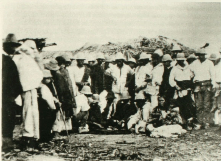
Peones apostando, Mostazal, 1862. Museo Histórico Nacional.

La afición al juego y las apuestas era muy grande entre los chilenos, según el testimonio de algunos viajeros como Caldcleugh, quien señalaba al respecto: