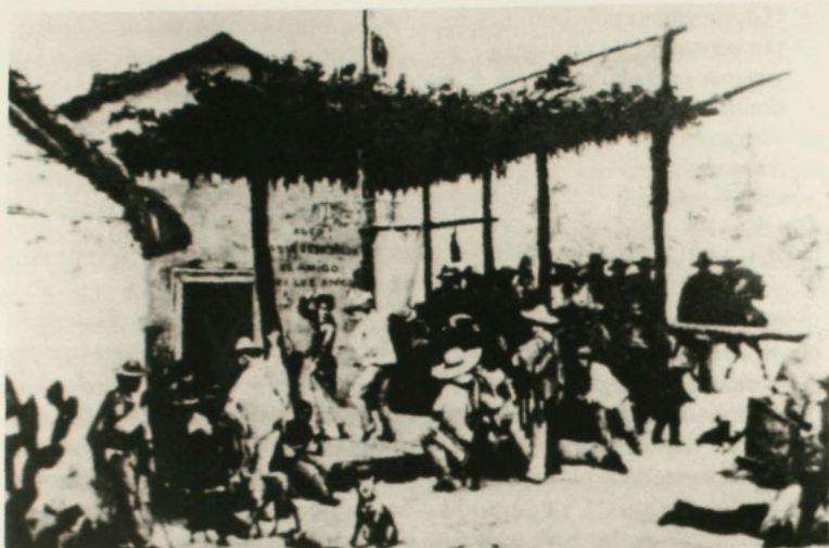
Una chigana rural. Óleo de Juan Mochi, Universidad de Chile.

bailan se ubican en un tablado bajo una ramada que es en el fondo una prolongación de la “casa de Silva”, el “amigo de los amigos” 76 .