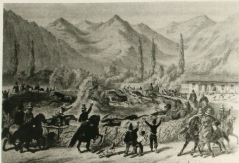
Trilla a yeguas, Álbum de Claudio Gay .

“...Se llama rodeo la reunión que se hace en la primavera de todos los animales dispersos en la hacienda. En esta época, varias centenas de jinetes arrean delante de ellos, los innumerables ganados que entran revueltos en un gran local, rodeados de empalizadas. Este espectáculo es curioso y grandioso. El corral se llena como si un mar viviente se precipitase en él, después de romper sus diques. El guaso triunfa en medio de esta mezcla furibunda: entonces es cuando se siente rey, y mira con piedad a los habitantes de las ciudades o al viajero europeo que acuden a los rodeos llevados por la curiosidad. Las diferentes especies de animales son separadas por los guasos y conducidas a corrales más pequeños; con un fierro candente se marcan los bueyes, las vacas, los terneros, y se separa el ganado viejo en dos grupos, del cual uno se destina a la engorda, y el otro a la matanza. Mientras el animal no engorda hasta que pueda dar 50 kilogramos de grasa, no se le considera bueno para la matanza, que constituye el segundo trabajo de la hacienda. Se les conduce, entonces, a las ramadas, especie de galpones cubiertos, donde, después de haberlos muertos, se les despresa. Una parte de la carne abastece los mercados del país, la otra, salada secada al sol, se denomina charqui y se remite al norte de Chile...” 58 .