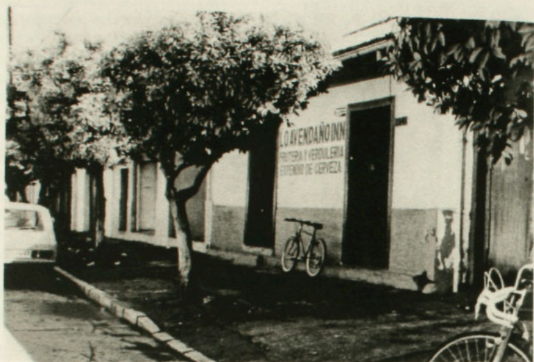
“Lo Avendaño Inn”, frutería, verdulería y expendio de cervezas, Nancagua, 1997.

Tylor, Mannhardt, Frazer, y lo aplicaron otros menos notorios. Lo han utilizado a veces también, en propio beneficio algunos teólogos. Pero hablar de ‘supervivencias’ y no de fenómenos de sincretismo, de fusión, de transformación o de cambios, de significación en el orden temporal, no referirse a expresiones colectivas o individuales de deseos, emociones y pasiones en otro orden, para buscar la raíz de todo en un ‘culto prehistórico’ en una ‘cultura’ antiquísima reconstruida y caracterizada con arreglo a lo que uno cree la mayor expresión de primitivismo, es darle al hombre menos capacidades que las que en realidad tiene y erigirse en ‘calificador’, si no del Santo Oficio, sí del Santo Progreso” 294 .