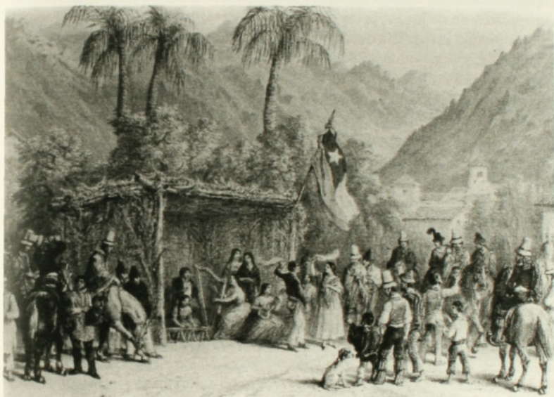
Una chingana. Album de Claudio Gay.

Cabe señalar que en los Censos de Población no aparece el oficio de chingano(a), pero sí el de fondista, lo que es prácticamente lo mismo. En 1854 la provincia de Colchagua aparece con seis fondistas hombres y una mujer 116 . Sin duda, el resto de los chinganeros(as) deben aparecer bajo otros rótulos, tal vez porque tenían además otros oficios que desarrollaban durante la semana o porque instalaban sus recintos sólo ocasionalmente.