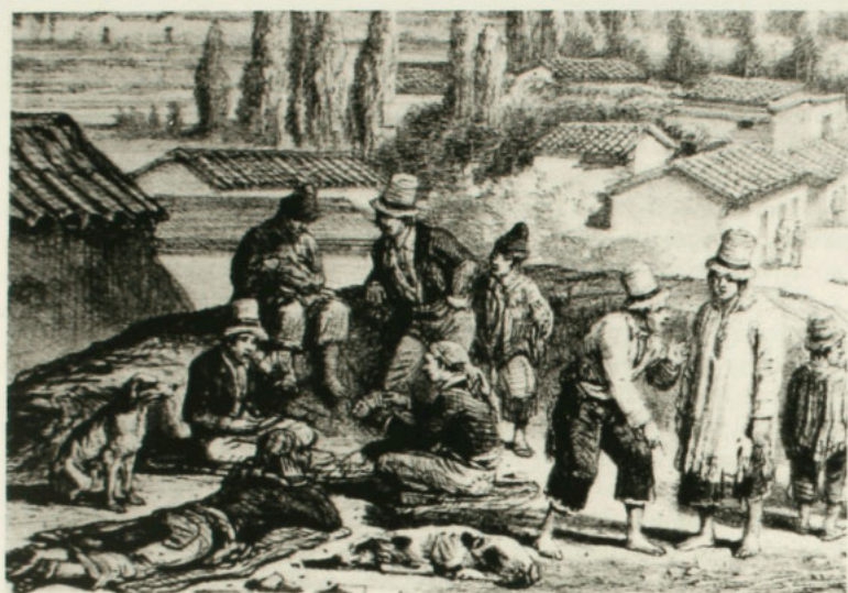
Peones jugando al naípe, fragmento del grabado Vista del valle Mapocho . Álbum de Claudio Gay.

ban los directamente involucrados en el juego, sino que también los “mirones”, aquellos que se reunían alrededor para ver, gozar o sufrir con el desarrollo de las apuestas. En la fotografía vemos sólo a personajes populares, lo cual se desprende del tipo de vestimentas. Quienes aparecen son en su mayoría adultos, salvo algunos jóvenes mezclados con el grupo, un niño que está al lado izquierdo, al lado de una vara que topa el suelo, y otro del que se ve sólo el rostro, detrás de la única mujer, sentada en el suelo y sosteniendo a su pequeño hijo. También se puede apreciar a algunas personas cerca del manto o poncho sobre el cual se ponen las cartas, tal vez esperando integrarse al juego en la próxima partida. Uno de ellos lleva un manto cruzado sobre el cuerpo, y parece sostener en sus manos algún tipo de moneda.