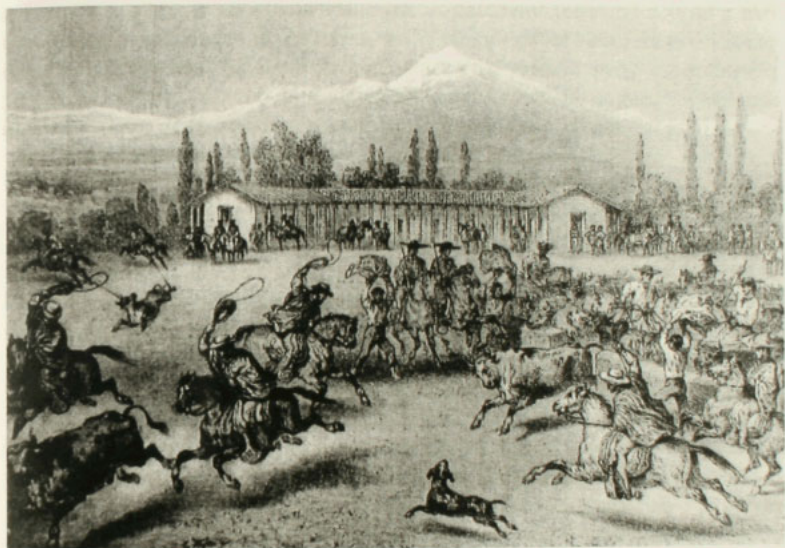
El apartado y matanza, Recaredo Tornero, Chile Ilustrado , reimpresión de 1996.

“Como sucede con todos los trabajos agrícolas, se ejecuta en medio de fiestas, de chinganas, etc., y mas aun que en cualquier otra circunstancia, porque como hemos dicho, entónces es cuando el jinete puede mejor que nunca poner en evidencia su habilidad para luchar con estos numerosos animales...” 59 .