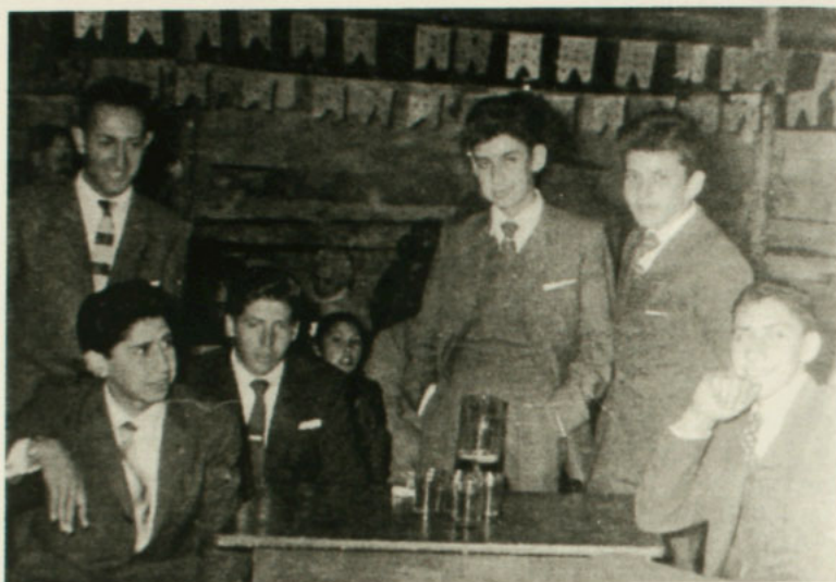
Fonda nancagiina con ocasión del sesquicentenario. Nancagua, 18 de septiembre de 1960.

participantes, en su totalidad hombres, pasan noches enteras probando suerte con el rona y suerte , esquivando a los borrachos que se abalanzan encima de los apostadores. La rayuela, expresión sobre la cual no encontramos muchas referencias durante nuestra investigación, sigue siendo una forma de entretenimiento y sociabilidad muy importante. Diversas personas se reúnen, especialmente los domingos en la tarde, para jugar a los tejos, acompañados de la chicha y el vino que amenizan el desarrollo del juego.